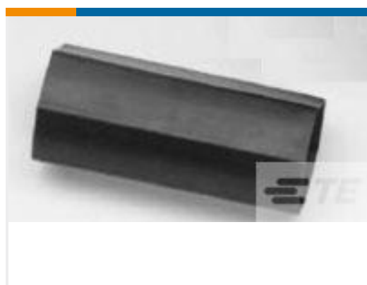
TE 产品编号CU3844-000 HRSR-300FR-8/NM