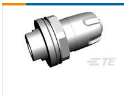
TE 产品编号1693741-1 CONN SHELL KIT, D-HOLE BULKHD, HA