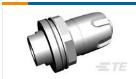
TE 产品编号1693741-1 CONN SHELL KIT, D-HOLE BULKHD, HA