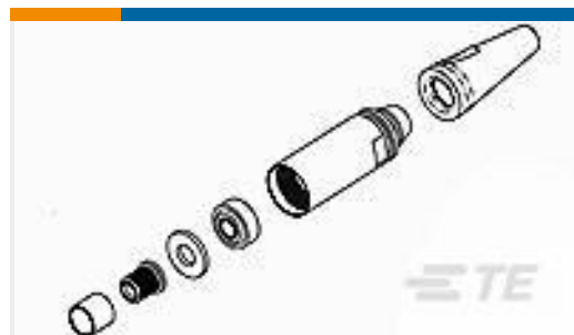
TE 产品编号1828700-1 CBL ADPT,PRO BEAM MINI PLUG 5.0 AL EPDM