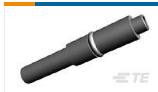
TE 产品编号1754700-1 FERRULE KIT, SM,125,MINI EB