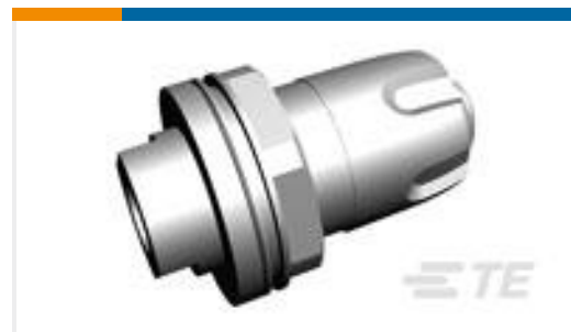
TE 产品编号1693741-1 CONN SHELL KIT, D-HOLE BULKHD, HA