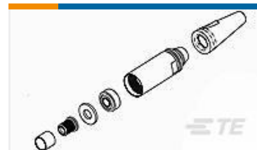
TE 产品编号1828700-1 CBL ADPT,PRO BEAM MINI PLUG 5.0 AL EPDM