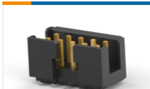
TE 产品编号1-2373376-0 10P,2MM,SHRD HDR,DRVT,SMD,0.1 AU,TB