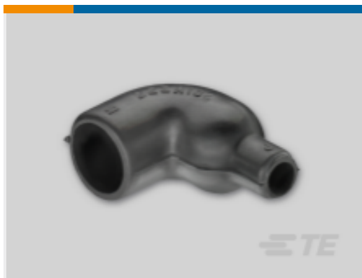
TE 产品编号806823-000 球形热缩护套：有嘴，直角