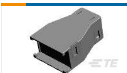
TE 产品编号1986185-1 Strain Relief,6 Posn,D5200 Dynamic. 2