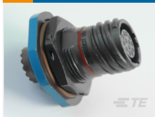
TE 产品编号YDTS24W13-35SBV001 RECP ASSY