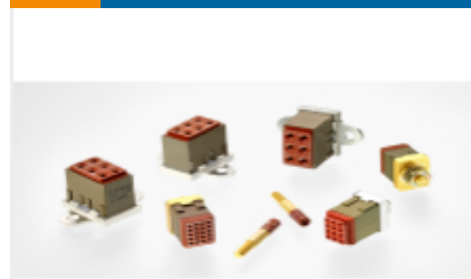
TE 产品编号CTJ720K01B MODULE ASSY