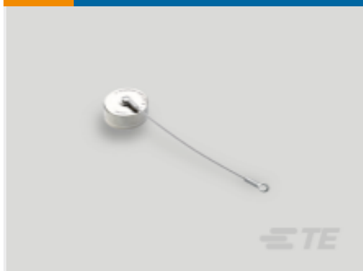
TE 产品编号YDTS33T17RV0010000 CAP ASSEMBLY