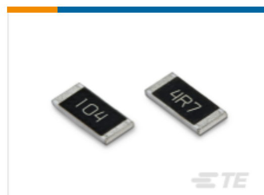
TE 产品编号 4-2176455-6 CPF 0402 324K 0.1% 25ppm 1K RL