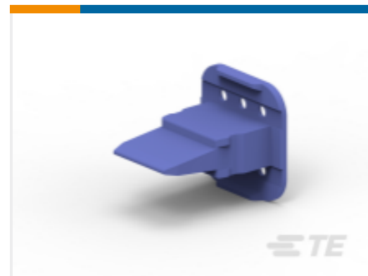
TE 产品编号 W6S2-P012 WEDGE LOCK