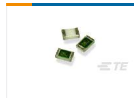
TE 产品编号 3-1879216-5 CPF0402 200K 0.1% 25PPM 1K RL