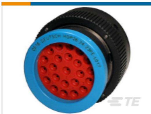
TE 产品编号 HDP26-24-23PE-L017 PLG, 23P, BLK, E, RNG, 16, P