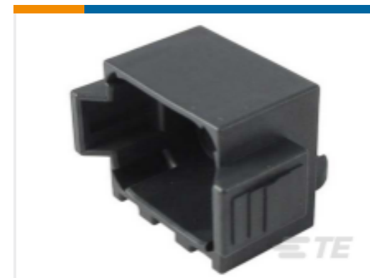
TE 产品编号 1011-348-0805 DUST CAP, 8P, PLG, BLK, DT