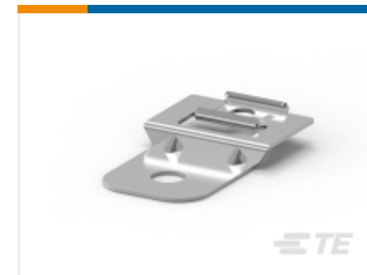
TE 产品编号 1027-017-1200 CLIP, STEEL, ZINC, 8.2MM HOLE, SIDE