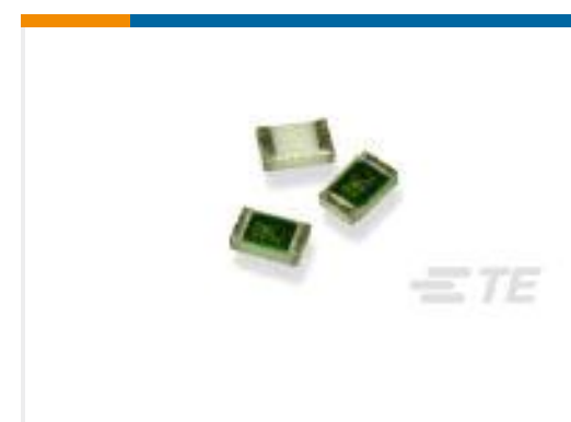
TE 产品编号 3-1879216-2 CPF0402 150K 0.1% 25PPM 1K RL