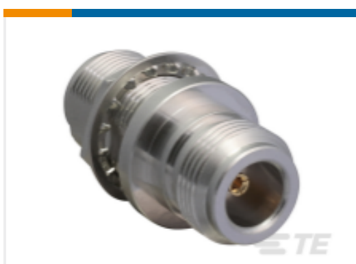
TE 产品编号 ADP-NF-NF-B-W N Type Jack to N Type Jack Bulkhead