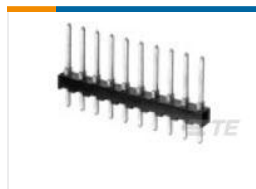
TE 产品编号 87224-4 04 MODII HDR SRST UNSHRD .100