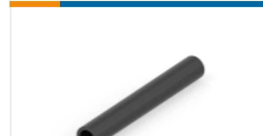
TE 产品编号NB11622001 ATUM-6/2-0-MS-STK