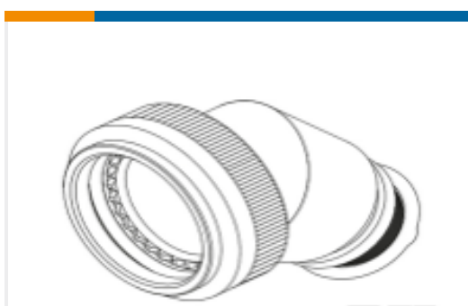
TE 产品编号EH9714-000 TXR40AZ45-1007AI