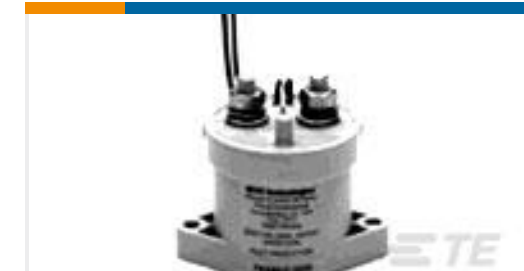
TE 产品编号1618002-7 EV200AAANA=RELAY, EV200 SPST-N