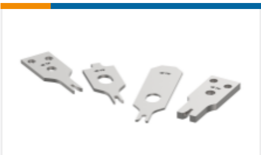
TE 产品编号456432-9 CRIMPER, WIRE .250 "F" (.187)