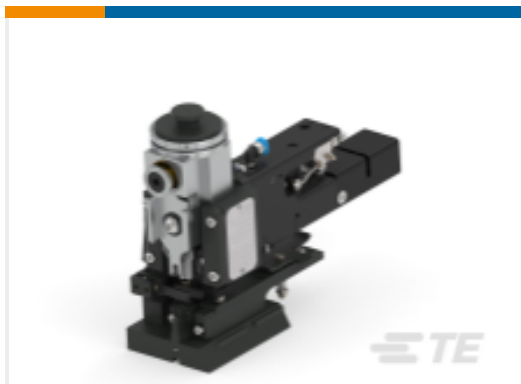
TE 产品编号2150612-1 OC-AT-E-FM-090F133F-029-0720