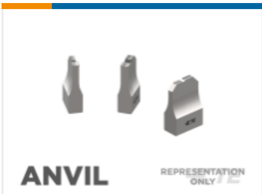
TE 产品编号2077599-2 SPECIAL ANVIL