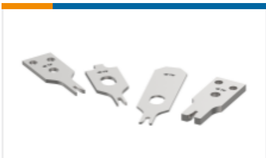
TE 产品编号1803243-1 CRIMPER, INSULATION O