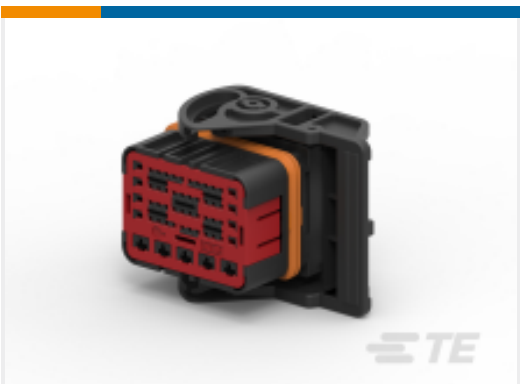
TE 产品编号6-2208775-4 53POS, MIXED,REC HSG,ASSY, SEALED