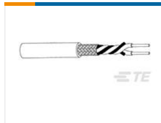
TE 产品编号F21712-000 10612-24-9-F871