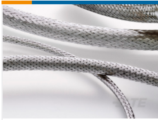
TE 产品编号EG3249-000 LWB-103-20.0 (50)