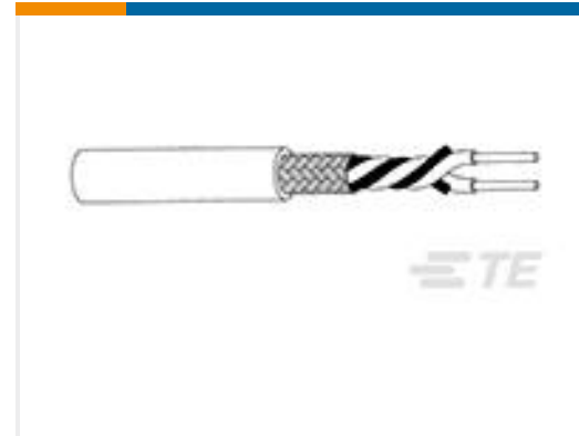
TE 产品编号F21712-000 10612-24-9-F871