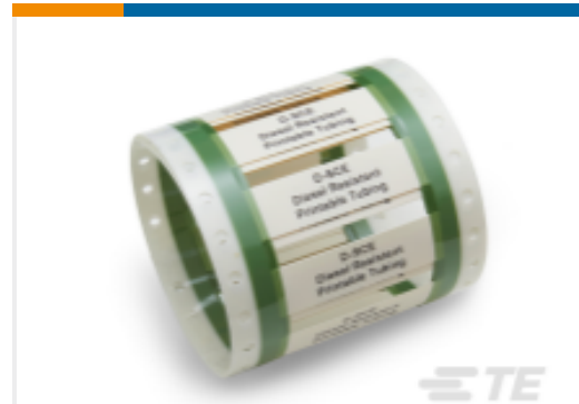
TE 产品编号872083-000 D-SCE Fluid Resistant Sleeves