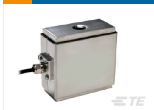
TE 产品编号EFN31-100N-C20005 FN3148-100N-/SC