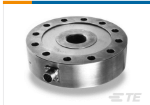
TE 产品编号EFN30-50KN-C20002 Load Cell up to 200,000 Lb, FN3000