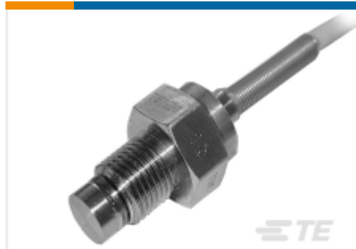
TE 产品编号EXPC1-100BS-C00002 M10X1 mV 小型压力传感器