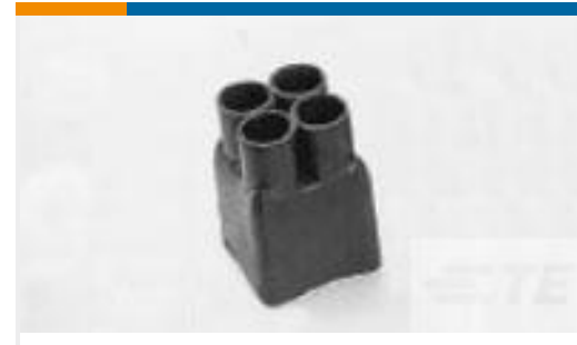
TE 产品编号034084-001 F133-200-FR