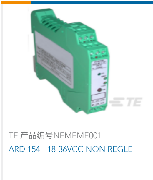
TE 产品编号NEMEME001 ARD 154 - 18-36VCC NON REGLE