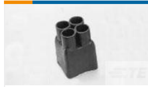
TE 产品编号034084-001 F133-200-FR