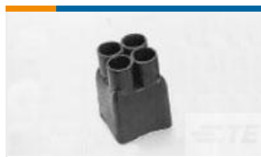
TE 产品编号034084-001 F133-200-FR