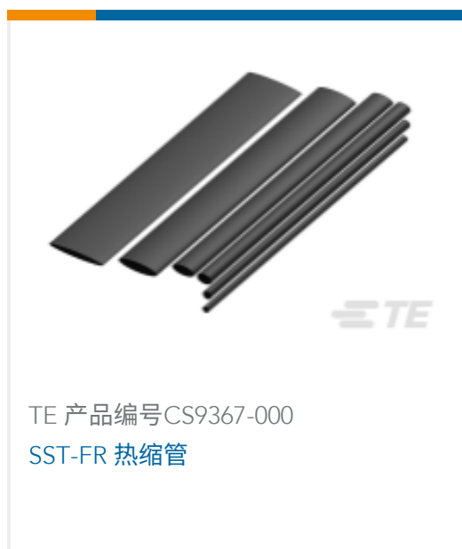
TE 产品编号CS9367-000 SST-FR 热缩管