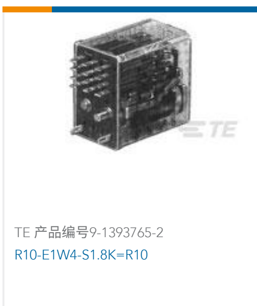
TE 产品编号9-1393765-2 R10-E1W4-S1.8K=R10