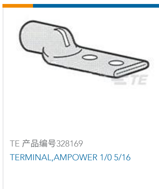
TE 产品编号328169 TERMINAL,AMPOWER 1/0 5/16