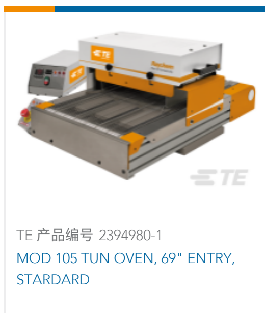
TE 产品编号 2394980-1 MOD 105 TUN OVEN, 69" ENTRY, STANDARD