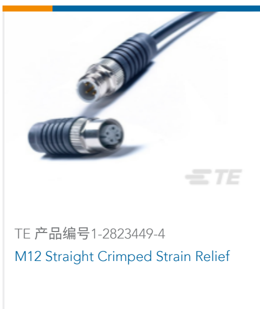
TE 产品编号1-2823449-4 M12 Straight Crimped Strain Relief