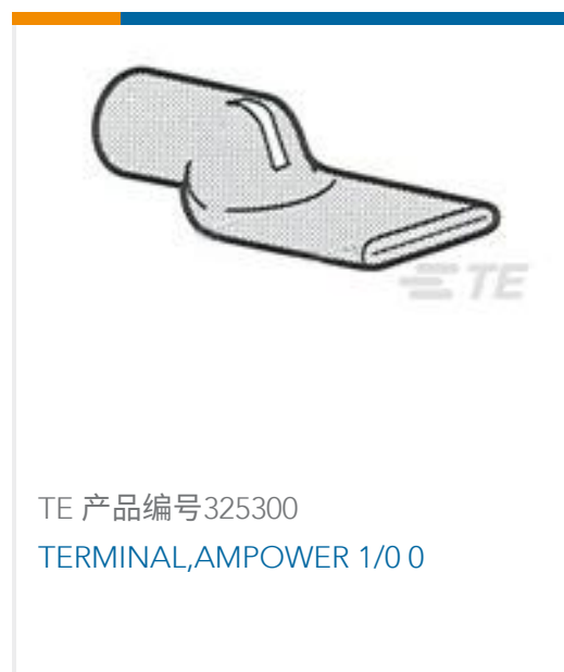
TE 产品编号325300 TERMINAL,AMPOWER 1/0 0