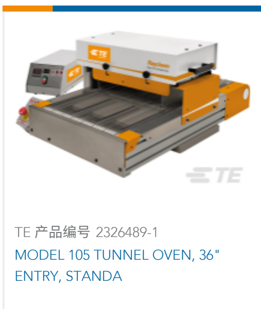
TE 产品编号 2326489-1 MODEL 105 TUNNEL OVEN, 36" ENTRY, STAND