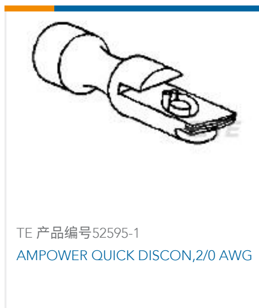
TE 产品编号52595-1 AMPOWER QUICK DISCON,2/0 AWG