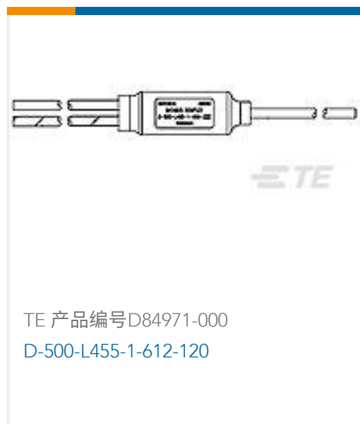
TE 产品编号D84971-000 D-500-L455-1-612-120