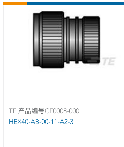
TE 产品编号CF0008-000 HEX40-AB-00-11-A2-3