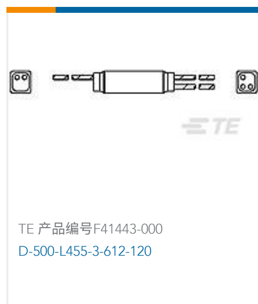
TE 产品编号F41443-000 D-500-L455-3-612-120