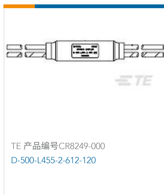
TE 产品编号CR8249-000 D-500-L455-2-612-120