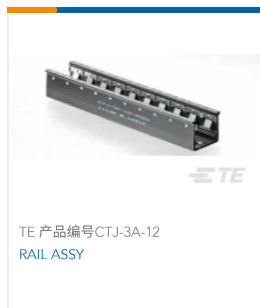
TE 产品编号CTJ-3A-12 RAIL ASSY