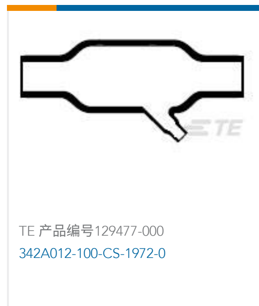
TE 产品编号129477-000 342A012-100-CS-1972-0