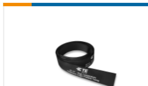
TE 产品编号ER2139-000 HT-CT-50M-3/32-OUT-0