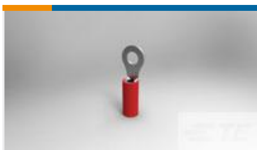
TE 产品编号36152 PIDG R 22-16 COMM 22-18 MIL 6