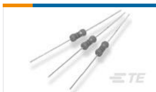
TE 产品编号1-1625878-3 FRN25 5% 4R7