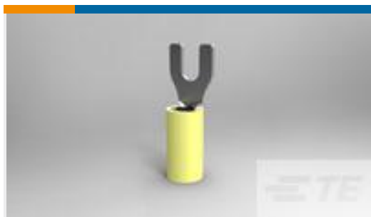
TE 产品编号32588 TERMINAL,PIDG SPD 12-10 8