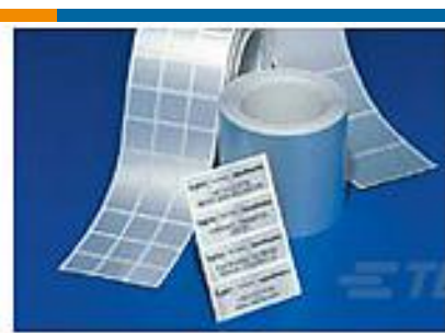
TE 产品编号C57207-000 MP-381127-5-8A