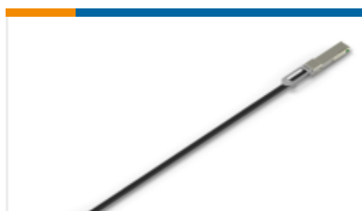
TE 产品编号233393-7 QSFP 25GIG 30AWG 3 METER