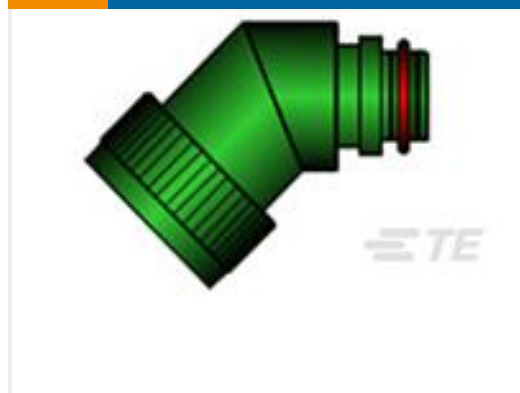
TE 产品编号A05444-000 TXR41AB45-2008BI