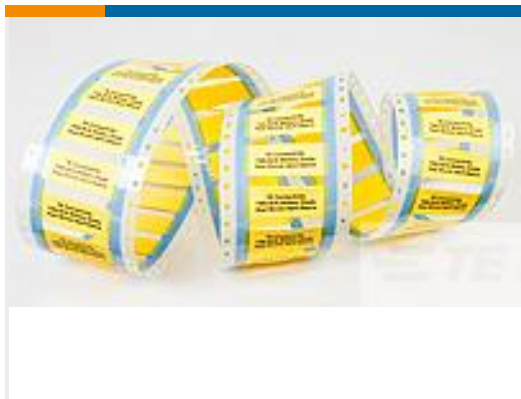
TE 产品编号404545-000 TMS-SCE-1K-3/4-2.0-6