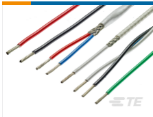
TE 产品编号2611473001 44A0111-12-54