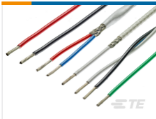
TE 产品编号2823013001 44A0211-8-9