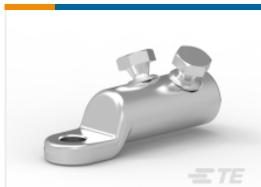
TE 产品编号F62708-000 BLMT-120/300-13