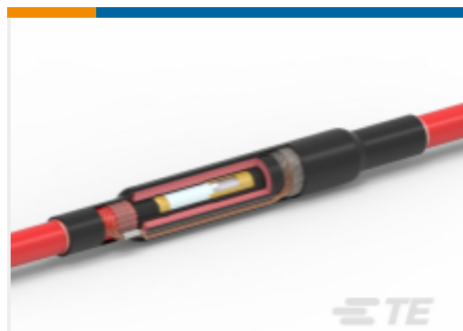
TE 产品编号743209-000 12-42 kV 热缩电缆接头