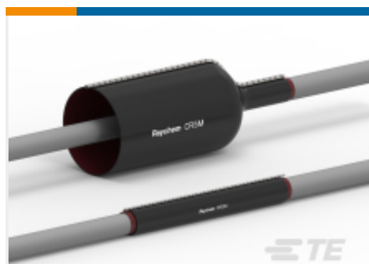
TE 产品编号 7-2819215-6 CRSM 84/20-MCUSB-300-PE-EDE