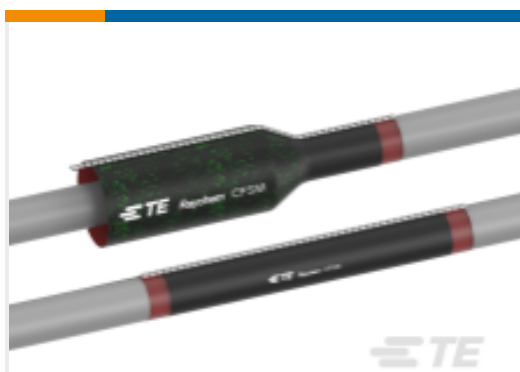
TE 产品编号 CAT-CNSM-CFSM Raychem Heat Shrink Reinforced Wraparound Sleeves