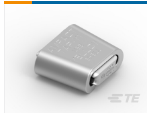
TE 产品编号83861-1 AMPACT TAP 1431 AAC-1272 ACSR