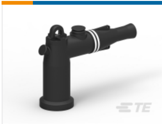
TE 产品编号BM1541-000 Loadbreak Elbow: 200A, 15 and 25 kV