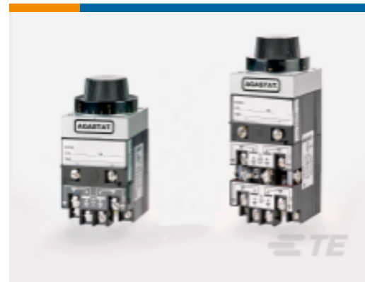
TE 产品编号6-1423157-2 7012ADT=RLY,STD,ON,2P,120AC,5