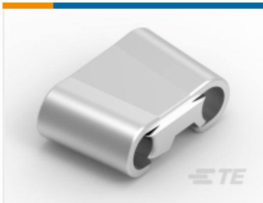
TE 产品编号1443209-1 CONNECTOR, 1351 KCMIL-636