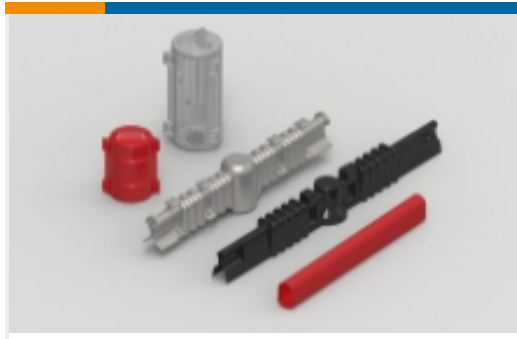
电气绝缘子外壳和附件(10)