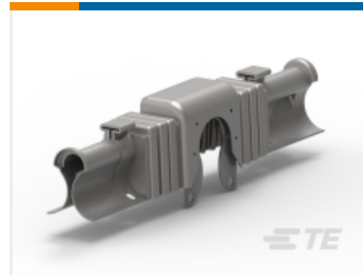
TE 产品编号CP4638-000 BCIC-G-HZPOR/3.5D-795-B6