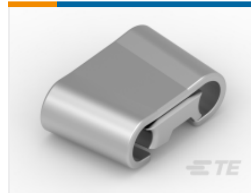
TE 产品编号109433-1 AMPACT ASSY,1272ACSR/954ACSR