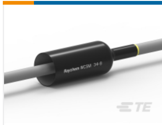
TE 产品编号EE0455-000 WCSM-34/8-300-S-(B50)