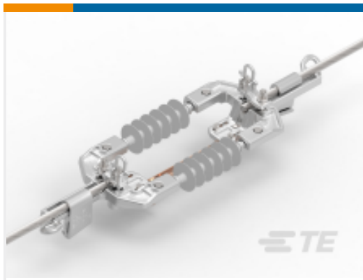
TE 产品编号1710727-8 29kILD-KS9C-T715.5-795