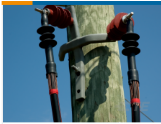
TE 产品编号834711-000 TFT-252E