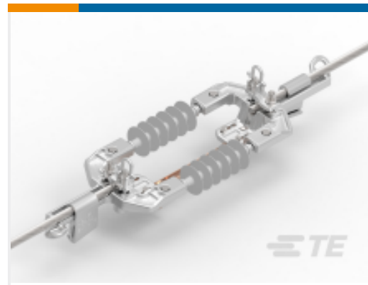
TE 产品编号1710727-2 29kILD-KS9C-w/T-4/0