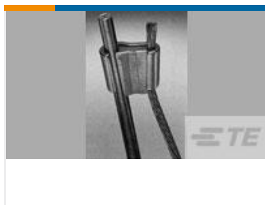
TE 产品编号275187-1 AMPACT CU TAP 250-4/0