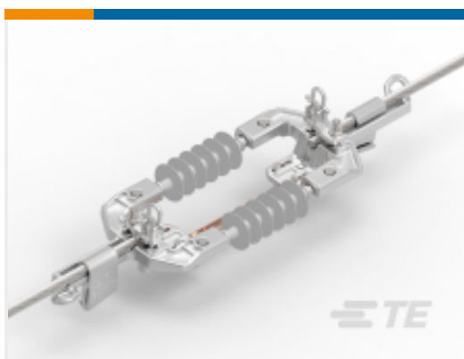
TE 产品编号1710729-1 29kILD-KR9C-w/T-1/0