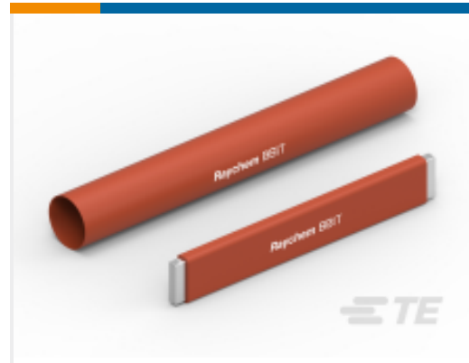
TE 产品编号188193-000 BBIT-25/10-A/U(B65)