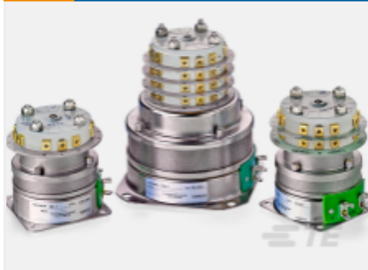
TE 产品编号1755066-1 MDR-7025=RLY,LTH,MED,28VDC, 16PDT