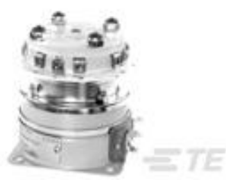
TE 产品编号6-1393139-3 MDR-5061=MDR