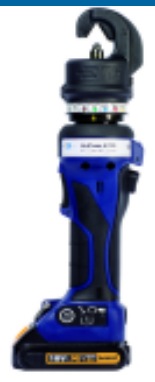
TE 产品编号 2107475-2 UNIPRESS 6/120 +COF+CHARG