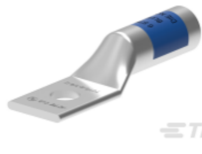
TE 产品编号EN3750-775 TCTS-3/0-1/2-U