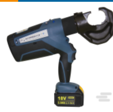
TE 产品编号 2107733-4 AUTOPRESS C120 18V+COF+CHARG 110V