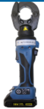
TE 产品编号 2107725-1 AUTOPRESS L62+ COF+CHARG