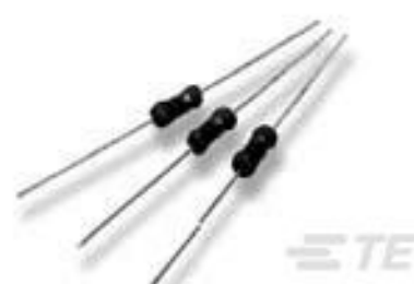
TE 产品编号3-1879351-7 RR01 5% 91K AMMO