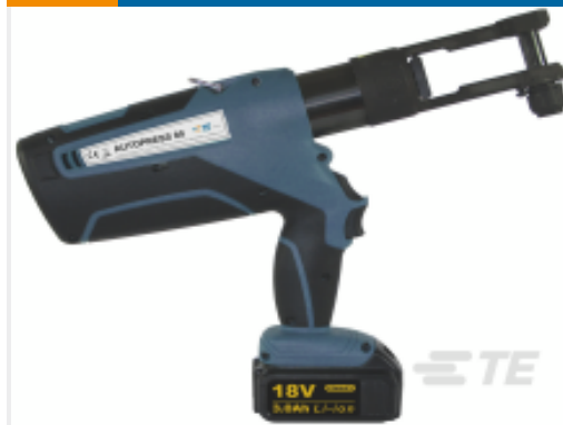
TE 产品编号 2107730-1 AutoPress 80 18V+COF+CHARG