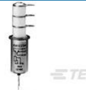
TE 产品编号5-1618239-1 K41C532=RELAY, VACUUM, SPDT