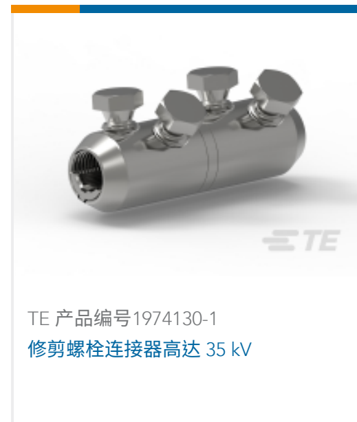
TE 产品编号1974130-1 修剪螺栓连接器高达 35 kV