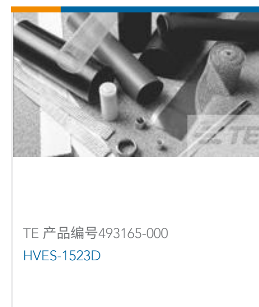
TE 产品编号493165-000 HVES-1523D