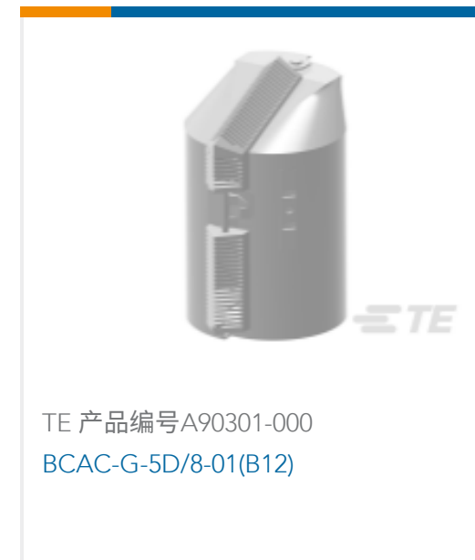
TE 产品编号A90301-000 BCAC-G-5D/8-01(B12)