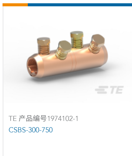
TE 产品编号1974102-1 CSBS-300-750