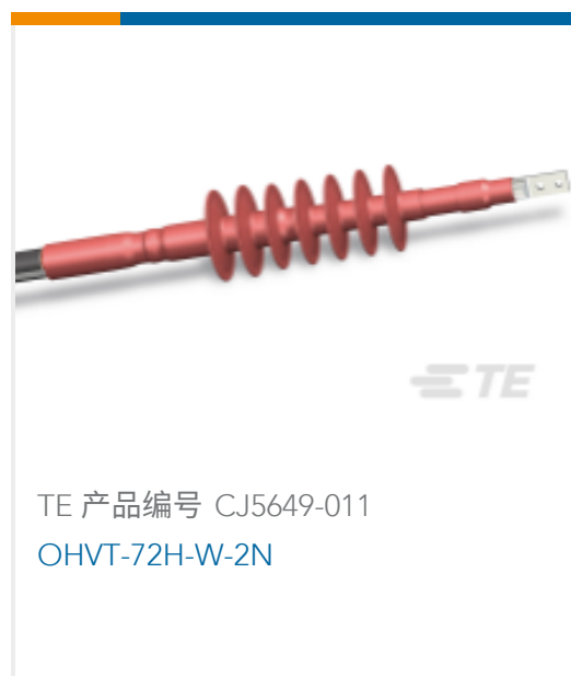
TE 产品编号 CJ5649-011 OHVT-72H-W-2N