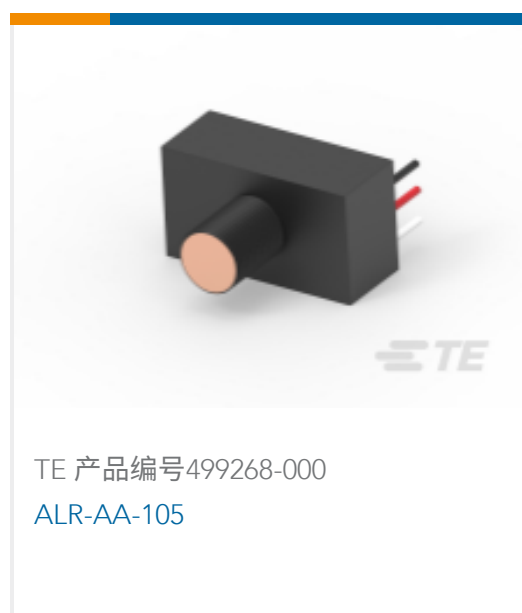
TE 产品编号499268-000 ALR-AA-105