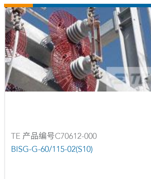
TE 产品编号C70612-000 BISG-G-60/115-02(S10)