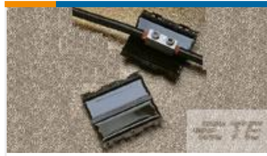
TE 产品编号408971-000 GILS-4/0(B18)