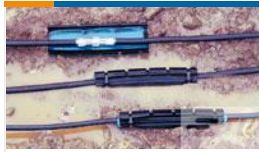
TE 产品编号A36570-000 GELWRAP-33/10-250(B6)