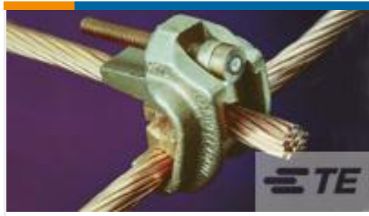
TE 产品编号83748-2 WRENCH-LOK 4/0-4/0, 350-2/0