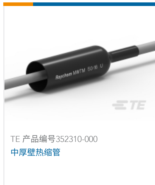
TE 产品编号352310-000 中壁厚热缩管