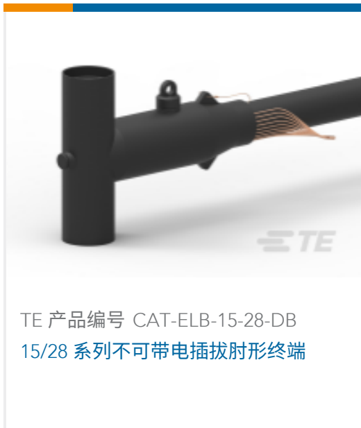
TE 产品编号 CAT-ELB-15-28-DB 15/28 系列不可带电插拔肘形终端