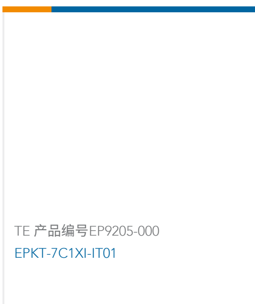
TE 产品编号EP9205-000 EPKT-7C1XI-IT01