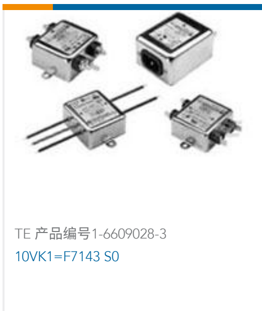
TE 产品编号1-6609028-3 10VK1=F7143 S0