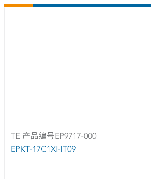
TE 产品编号EP9717-000 EPKT-17C1XI-IT09