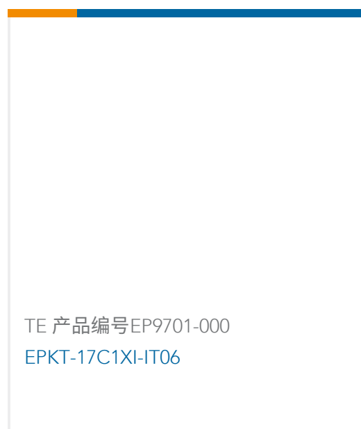
TE 产品编号EP9701-000 EPKT-17C1XI-IT06