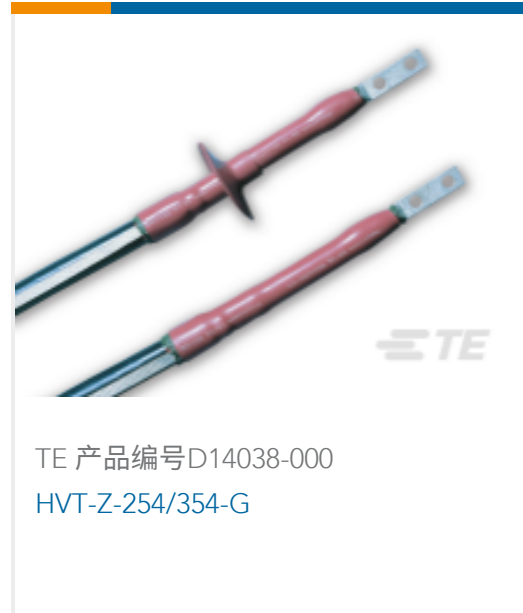
TE 产品编号D14038-000 HVT-Z-254/354-G