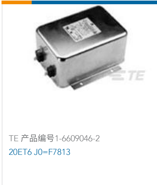
TE 产品编号1-6609046-2 20ET6 J0=F7813