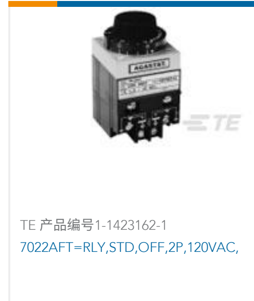
TE 产品编号1-1423162-1 7022AFT=RLY,STD,OFF,2P,120VAC,