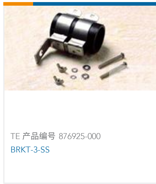
TE 产品编号 876925-000 BRKT-3-SS