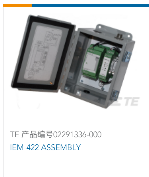
TE 产品编号02291336-000 IEM-422 ASSEMBLY