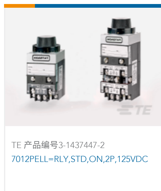
TE 产品编号3-1437447-2 7012PELL=RLY,STD,ON,2P,125VDC