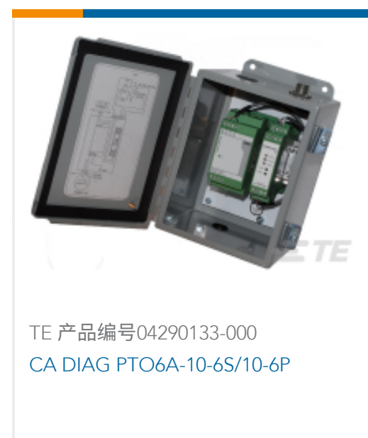
TE 产品编号04290133-000 CA DIAG PTO6A-10-6S/10-6P