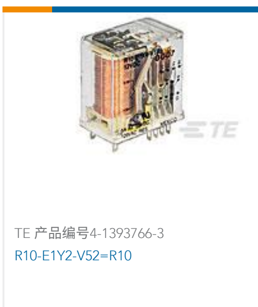
TE 产品编号4-1393766-3 R10-E1Y2-V52=R10