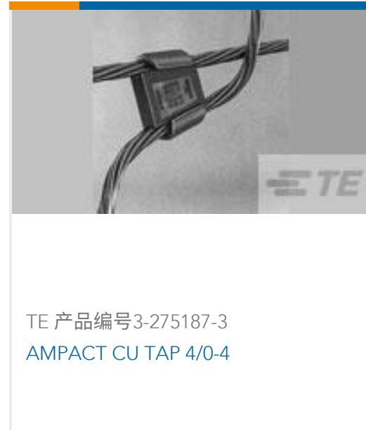
TE 产品编号3-275187-3 AMPACT CU TAP 4/0-4