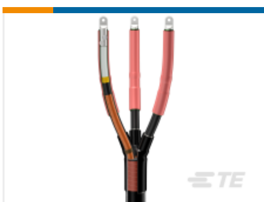
TE 产品编号E92435-063 POLT-12D/3XIH1