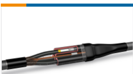
TE 产品编号D11309-070 POLJ-12/3X25-70