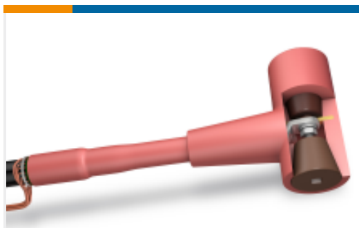
TE 产品编号555340-070 RICS-5123