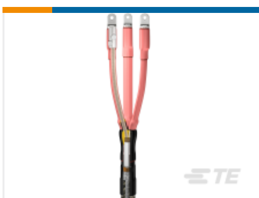
TE 产品编号C47372-064 GUST-12/25-50/800