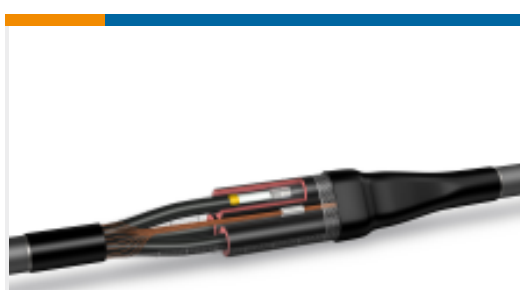
TE 产品编号A69078-064 POLJ-12/3X70-150