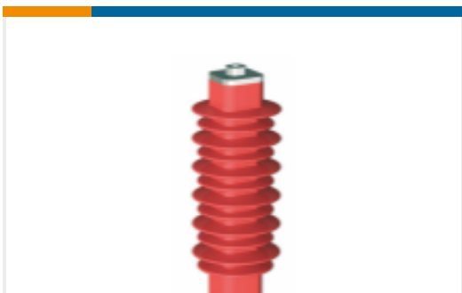
TE 产品编号EN6028-000 HDA-33M-B3-NFF