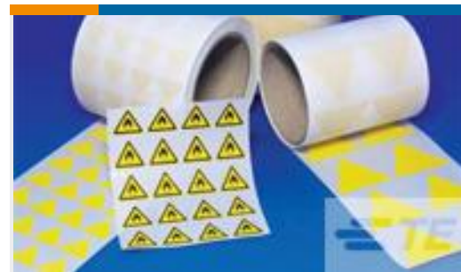
TE 产品编号4-1768018-2 EET-1325P-4