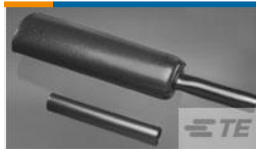
TE 产品编号420494-000 RMW-50/16-1200/ADH-0