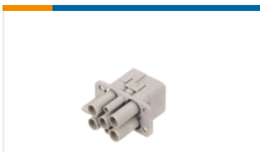
TE 产品编号T2080062201-100 HQ-4/2-F