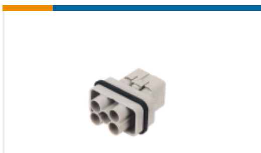
TE 产品编号T2080062101-100 HQ-4/2-M