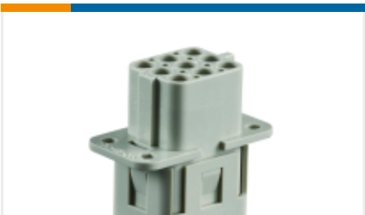
TE 产品编号T2019092201-000 HQ-008-F