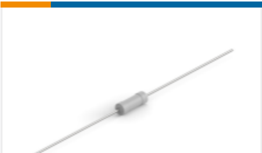
TE 产品编号2176411-9 1/2W SM M/OX 5% 24K