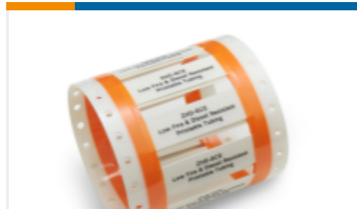
TE 产品编号EC9884-000 Fluid Resistant Sleeves, ZHD-SCE