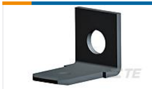
TE 产品编号42214-2 250 FASTON TAB TPBR