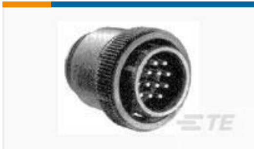
TE 产品编号213850-1 CPC PLUG ASSEMBLY SIZE 23-37