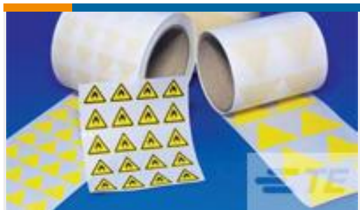
TE 产品编号4-1768018-2 EET-1325P-4