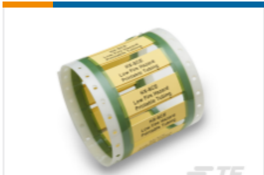
TE 产品编号F26167-000 HX-SCE Low Fire Hazard Sleeves