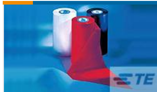
TE 产品编号557721-000 TMS-RJS-RIBBON-4RPSCE