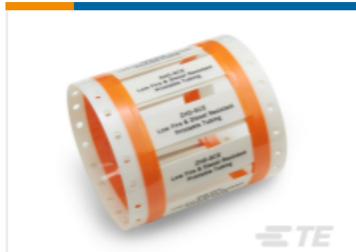
TE 产品编号EC9840-000 Fluid Resistant Sleeves, ZHD-SCE