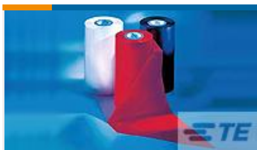
TE 产品编号557721-000 TMS-RJS-RIBBON-4RPSCE