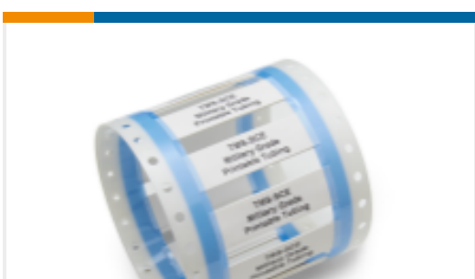
TE 产品编号5061850001 TMS-SCE Military Grade Sleeves