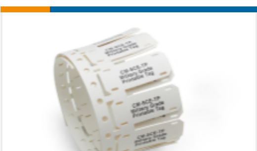
TE 产品编号E17344-000 CM-SCE-TP Military Grade Markers