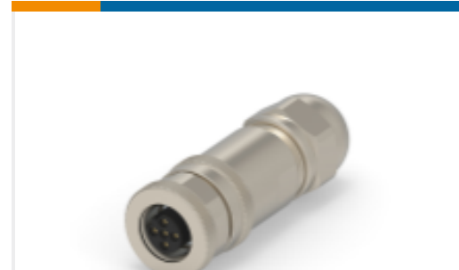
TE 产品编号T4110411051-000 M12 F, 5P GOLD, B_CODE S SHIELDED PG7