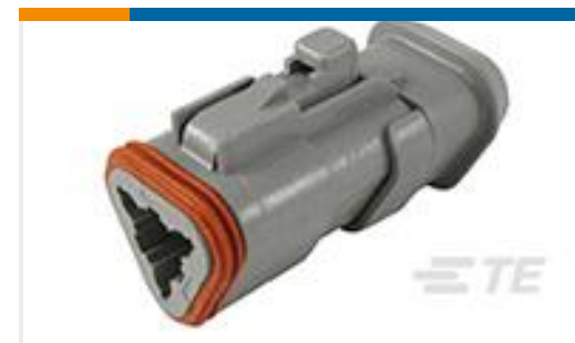
TE 产品编号DT06-3S-CE04 PLG, 3P, GRY, E, XCAP