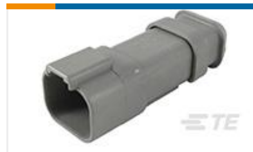
TE 产品编号DT04-4P-CE04 REC, 4P, GRY, E, XCAP