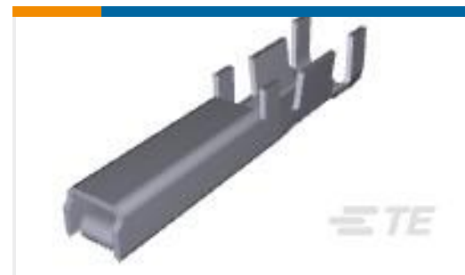
TE 产品编号917511-2 DYNAMIC D-3 REC CONT. 2L AU 0.38 L/P