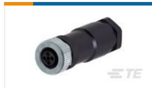
TE 产品编号2120948-1 M12 DC POWER CONNECTOR, T-CODED, SOCKET