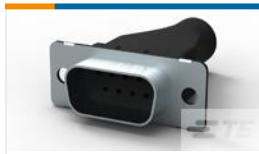
TE 产品编号1658645-1 KIT, HDP-20, OVRMLD, PLUG, SIZE 1,