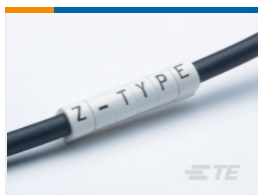
TE 产品编号EC1267-000 Z-Type Push-On Markers