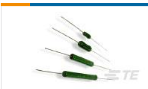
TE 产品编号3-1623774-9 C14 6K8 5% (LOOSE)