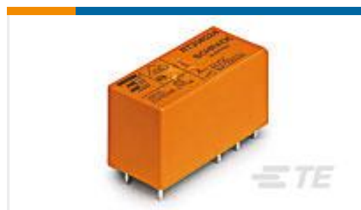
TE 产品编号2-1393243-3 RTE25110