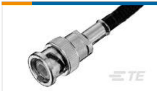
TE 产品编号5330876 BNC PLUG