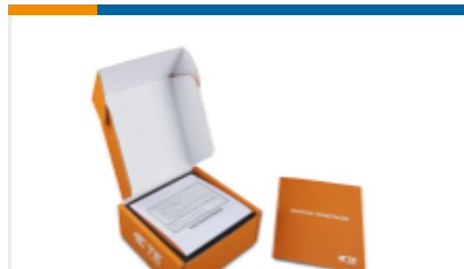
TE 产品编号1-2186546-1 WINTOTAL-7-END-USER-LICENCE