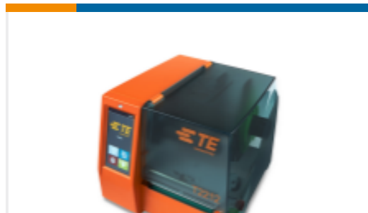
TE 产品编号1-2186527-1 T2212-PRINTER