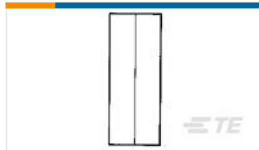
TE 产品编号8-35187-3 SPLICE,SOLIS PARA 2