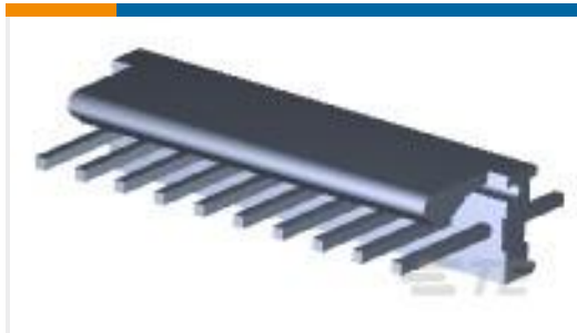
TE 产品编号1-641215-0 10P MTA100 HDR ASSY FL/ST 30AU