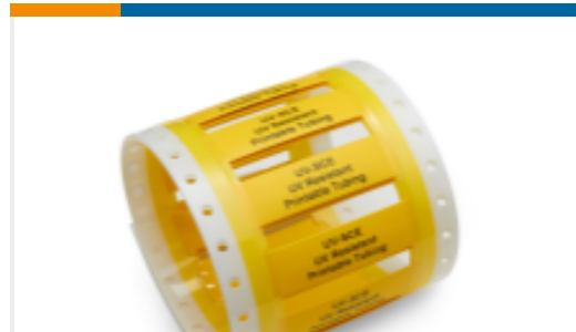
TE 产品编号EC6673-000 UV Resistant Sleeves, UV-SCE