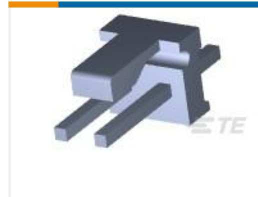
TE 产品编号644752-2 02P MTA156 HDR ASSY SQ STR F/L