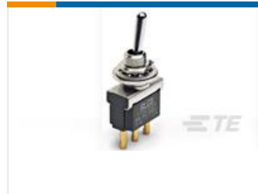
TE 产品编号2-6437630-0 FTD0904=MINIATURE TOGGLE