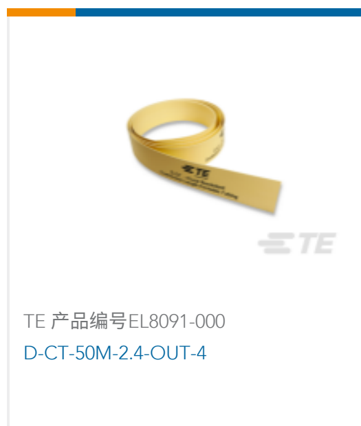
TE 产品编号EL8091-000 D-CT-50M-2.4-OUT-4