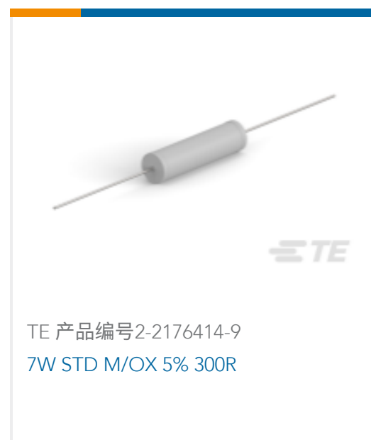
TE 产品编号2-2176414-9 7W STD M/OX 5% 300R