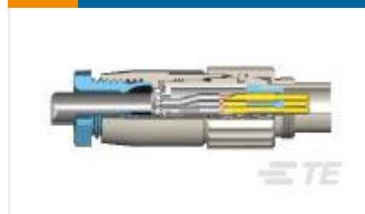
TE 产品编号2-1437719-1 T01-0550-P05-MALE PLUG CONNECTOR SOLDER