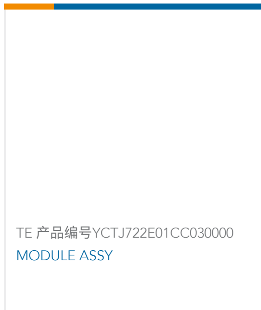
TE 产品编号YCTJ722E01CC030000 MODULE ASSY