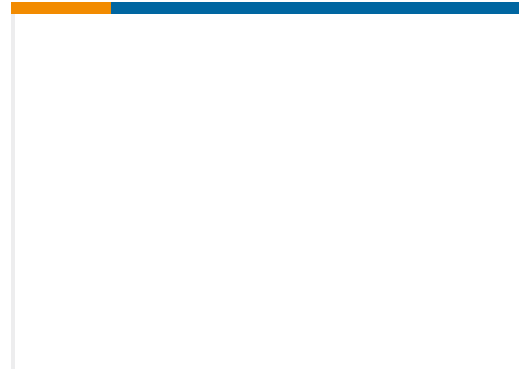
TE 产品编号EG1390-000 STXR40AZ00-1014BI