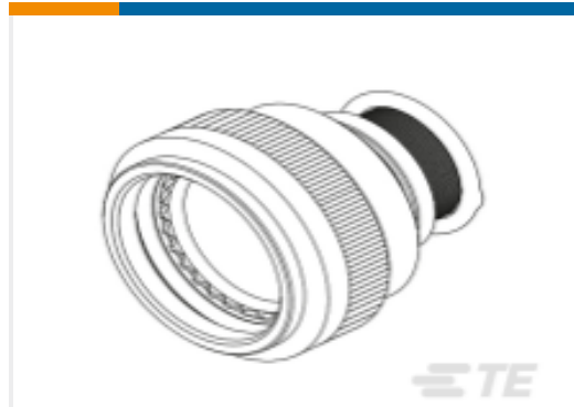
TE 产品编号119071-000 TXR40BW00-1608BI