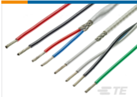
TE 产品编号CQ93593001 44A0821-8-0/2