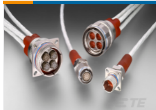
TE 产品编号YCFX26T2532JZN-1A0 PLUG ASSY