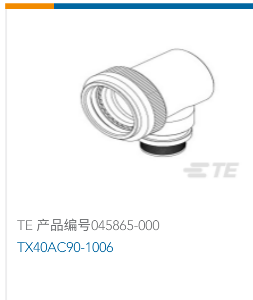
TE 产品编号045865-000 TX40AC90-1006