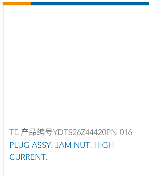
TE 产品编号YDTS26Z44420PN-016 PLUG ASSY. JAM NUT. HIGH CURRENT.