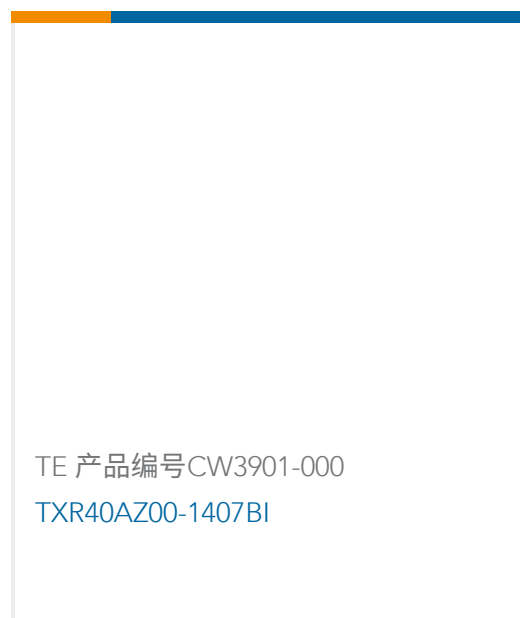
TE 产品编号CW3901-000 TXR40AZ00-1407BI