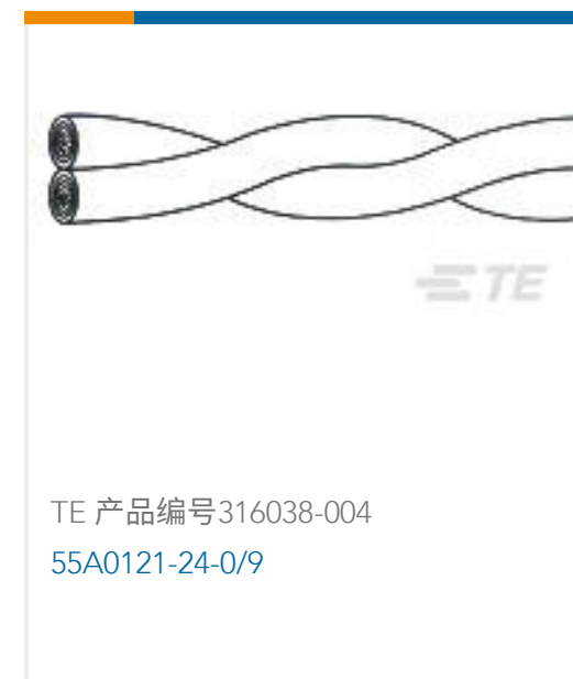
TE 产品编号316038-004 55A0121-24-0/9