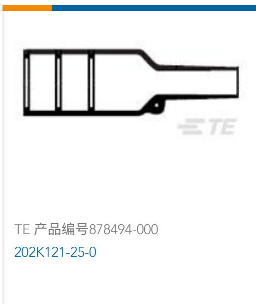
TE 产品编号878494-000 202K121-25-0