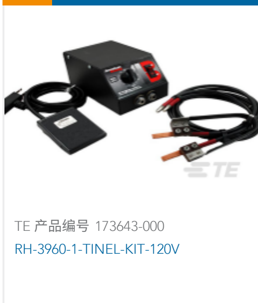
TE 产品编号 173643-000 RH-3960-1-TINEL-KIT-120V