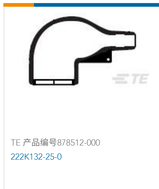
TE 产品编号878512-000 222K132-25-0