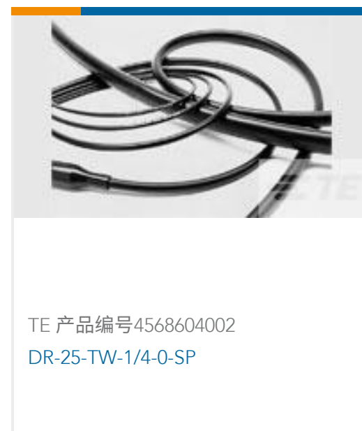
TE 产品编号4568604002 DR-25-TW-1/4-0-SP