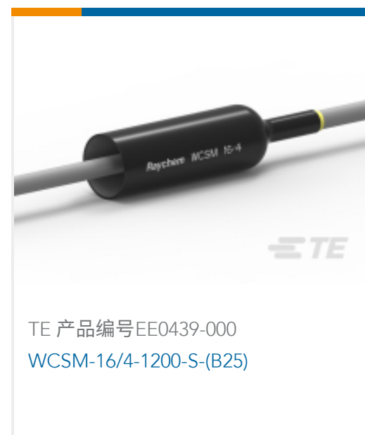
TE 产品编号EE0439-000 WCSM-16/4-1200-S-(B25)