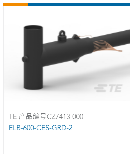
TE 产品编号CZ7413-000 ELB-600-CES-GRD-2