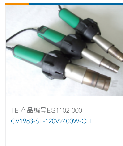
TE 产品编号EG1102-000 CV1983-ST-120V2400W-CEE