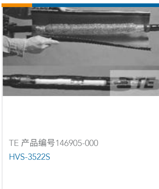
TE 产品编号146905-000 HVS-3522S