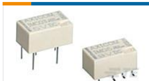
TE 产品编号1462042-8 IMC03GR=IM RELAY 140mW 5V 1CO