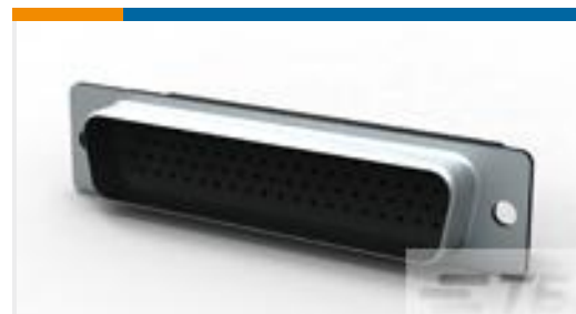
TE 产品编号1658674-1 HDP-22,PLUG,SIZE 5,78 POSN