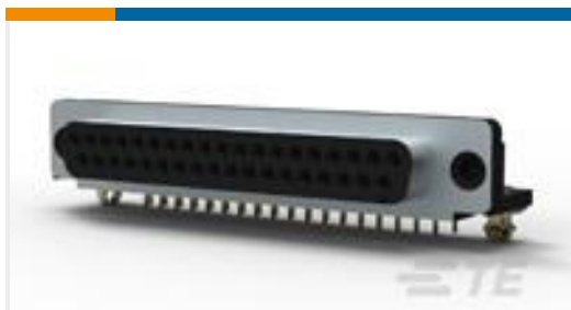
TE 产品编号5747847-4 37 MSFL RCPT RA 318 (IN,FM,BL)